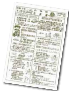
各駐在所で広報紙を作成し、住民に対して注意喚起や、地域の情報を提供します。

いましたが、現在は大字旭や沼田原などに、感染症対策をしながら月に一度は直接住民に会って話をしたり、広報紙を手渡したりして、地域との繋がりを保持するようにしています。