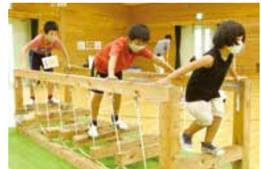
▲十津川村の木の遊具