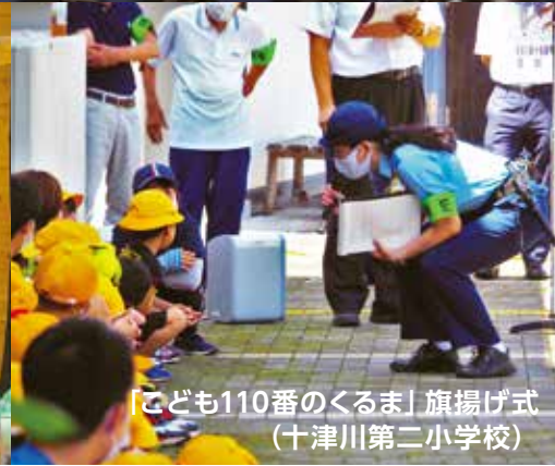
「子ども110番のくるま」旗揚げ式 （十津川第二小学校）