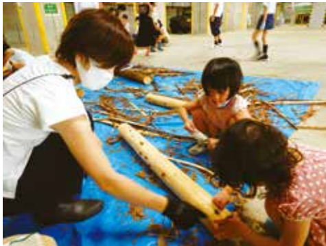
◀ヒノキ丸太の皮はがし体験