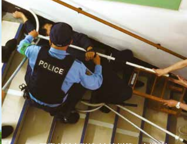
不審者対応訓練 (十津川第一小学校)