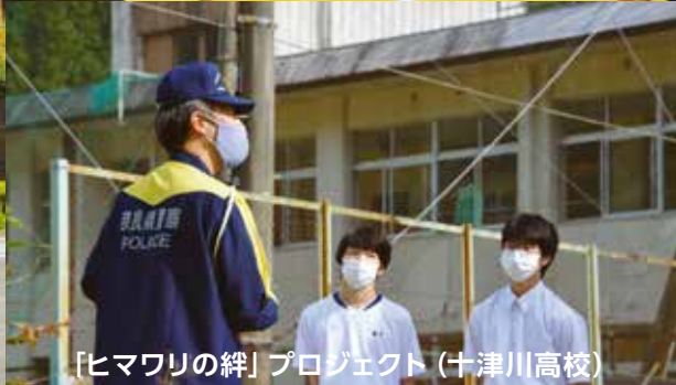
「ヒマワリの絆」プロジェクト (十津川高校)