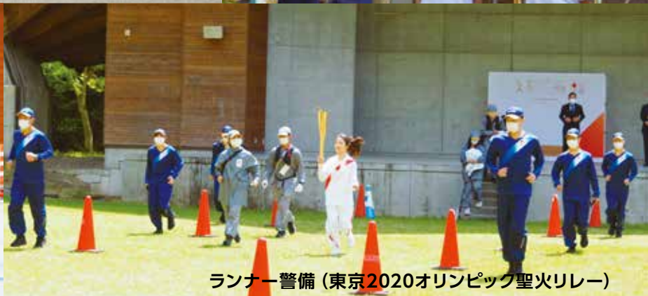
ランナー警備 (東京2020オリンピック聖火リレー)