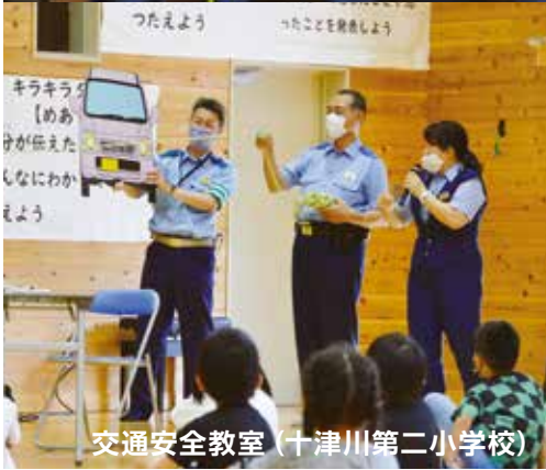
交通安全教室（十津川第二小学校）

村の安全を守るために、日々尽力している警察官。 警察官の皆さんは、どのような仕事をしているのでしょうか。 わたしたちの安全を守ってくれている警察官のことをもっと知ってもらおうと取材しました。