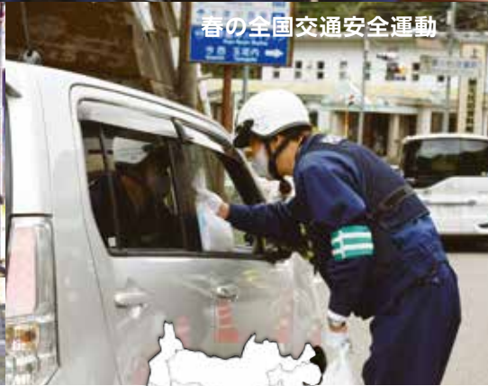
春の全国交通安全運動