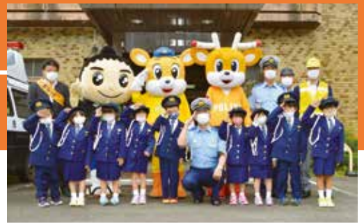
▲昨年の「秋の交通安全県民運動」で交通安全を呼びかけたキッズポリスタ